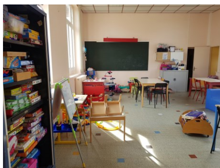
Divers espaces de jeux

Enfin en garderie, plusieurs points d'activités sont proposés pour permettre aux enfants d'être suffisamment espacés. Les jeux et les locaux sont désinfectés tous les soirs.