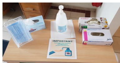
Dispositif à l'entrée de la mairie et de la garderie

Nous rappelons que le port du masque est obligatoire dans les locaux publics et aux abords de l'école. (Protocole sanitaire de septembre 2020)