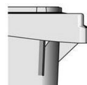
Figure 1 — Forme A de collerette

Il faut regarder la forme des collerettes :