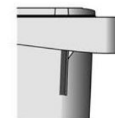
Figure 2 — Forme C de collerette

La forme A (figure 1) correspond à la nouvelle norme réglementaire.