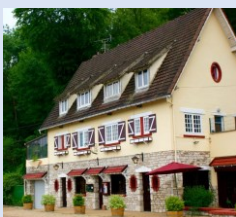
Le chineur gourmand

➤ Le repas des anciens est annulé. La Mairie offrira en remplacement un bon valable dans les restaurants de la commune. :